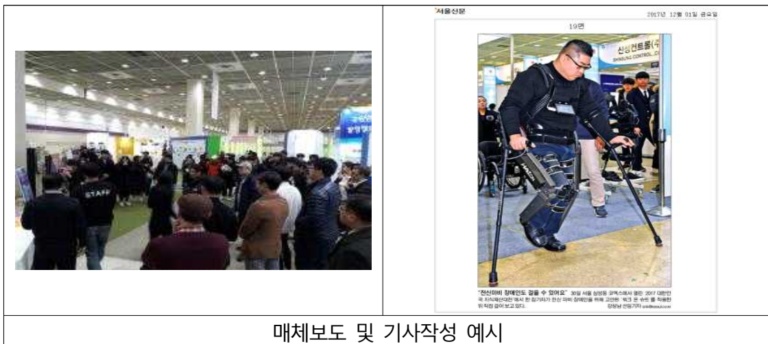
매체보도 및 기사작성 예시