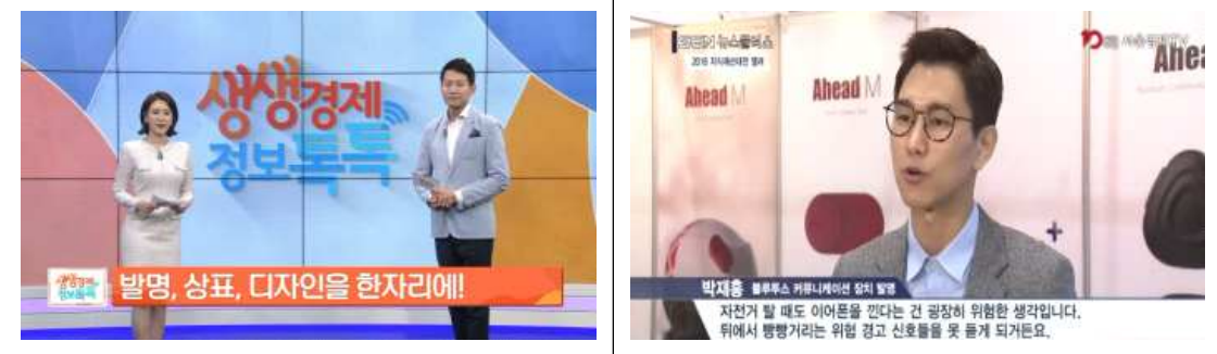
주요 매체 홍보 및 수상자 인터뷰(예시)