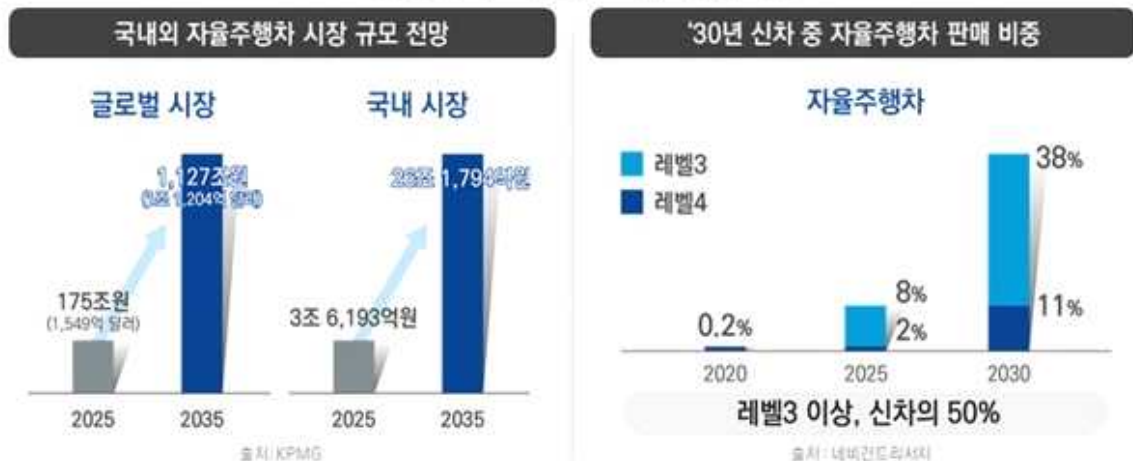
자율주행차 시장규모 및 판매 비중

자율주행 자동차를 운용함에 있어 가장 중요한 정보 중 하나가 차량의 위치 정보이며, 통상적으로 자율주행은 최소 20cm 의 오차를 허용한다. 현 시점에 20cm 정도 오차범위에 근접/상회하는 정밀 측위 기술들의 경우, 대